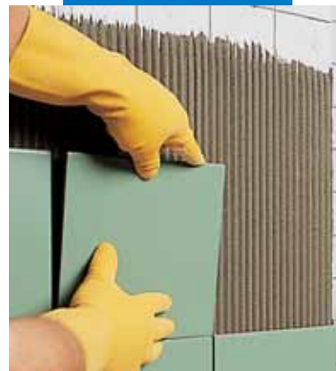
Нанесение поверх старой плитки