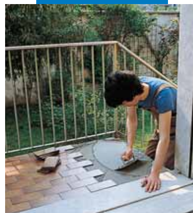
Гидроизоляция и укладка плитки с помощью смеси Kerabond T + Isolastic