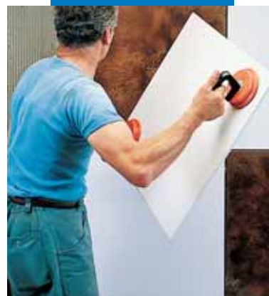
Укладка Keraion на стену