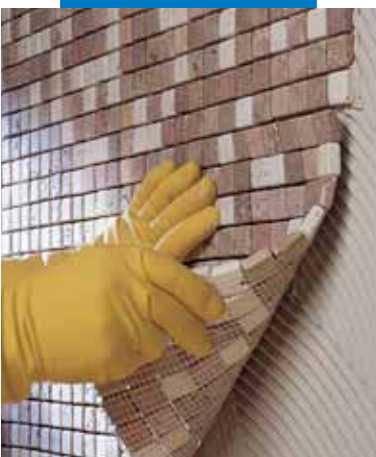
Укладка стеклянной мозаики 2x2 для стену