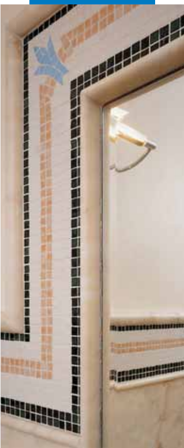
Пример художественного оформления мозаикой, сделанной из разных материалов