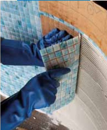
Укладка стеклянной мозаики 2x2 в бассейне с использованием Adesilex P10 и добавки Isolastic, разбавленной водой в соотношении 1:1